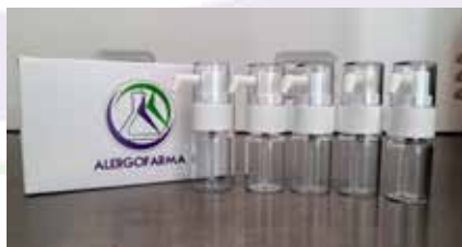
KIT DOSIFICADOR SUBLINGUAL 5 FRASCOS DE 5ML C/U