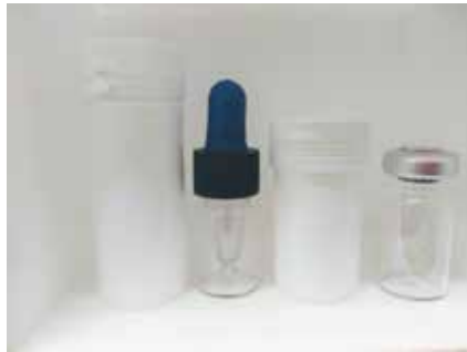
TARRO PARA GOTERO DE 5 ML TARRO PARA FRASCO 5 ML