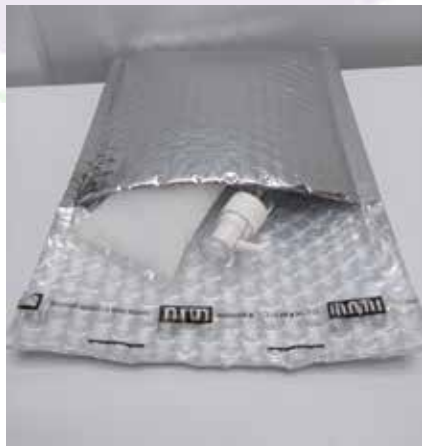
SOBRE ISOTÉRMICO 15 X 16 CM