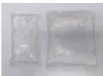
GEL REFRIGETANTE 10 X 6 CM 10 X 10 CM