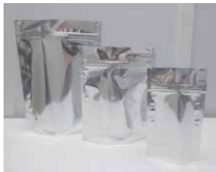
BOLSA METÁLICA 19 X 26 CM 15 X 20 CM 10 X 17 CM