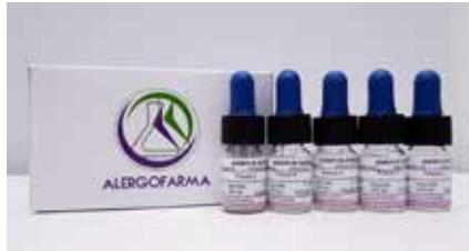
KIT GOTERO SUBLINGUAL 5 FRASCOS DE 5ML C/U