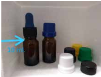
GOTERO ÁMBAR ESTÉRIL DE 10 ML. CON BULBO AZUL Y FRASCO ÁMBAR ESTÉRIL DE 10 ML CON TAPA (2 MODELOS DIFERENTES)