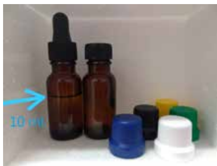
GOTERO ÁMBAR ESTÉRIL DE 15 ML. CON BULBO NEGRO Y FRASCO ÁMBAR ESTÉRIL DE 15 ML CON TAPA (2 MODELOS DIFERENTES)